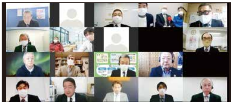
オンライン表彰式の様子