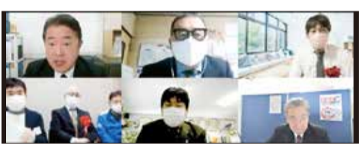
受賞者代表謝辞の様子