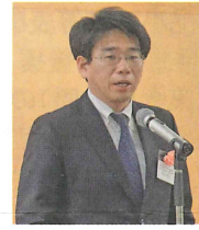
本日第31回牛乳販売店優 良事例発表会 が無事開催さ が

改めて牛乳販売店の原点を勉強させられた思いがある。集金に行き、お客さまの顔を見て、いろいろな話をする中でお客さまとの信頼関係を築いている。特に、競争の激しい地域であり、営利活動だけやっていてもお客さまに受け入れてもらえない。そのような土地柄で、どうやってお客さまと接するかという課題について、改めて訪問集金の重要性を学んだ。