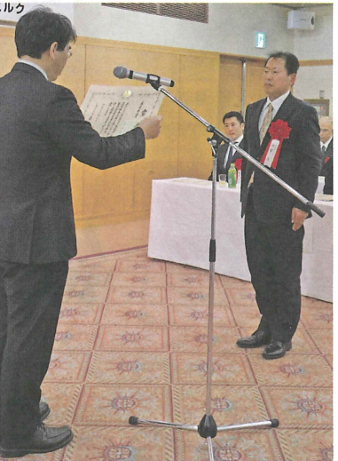
最優秀賞農林水産大臣賞の授与

なごる大きな要素となり。このため、優良事例発表会が今後も続くことにご期待申し上げます。農林水産省として、消費拡大については、全改協はじめ関係各団体と協力を取りつつ取り組んで参ります。一方、国内酪農生産基盤は若干弱くなつてきており、国内需要に見合った生産体制の維持拡大が図れるように、生産現場と一致団結しながら取り組みたいと思います。このように、生・処・販の皆さまの協力の下、国内の牛乳製品の安定供給を継続的に図つてゆきたいと考えておりますので、今後ともよろしくお願ひいたします。