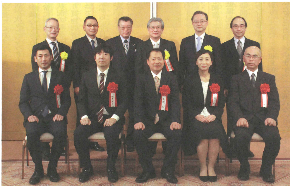
優良事例発表会受賞者