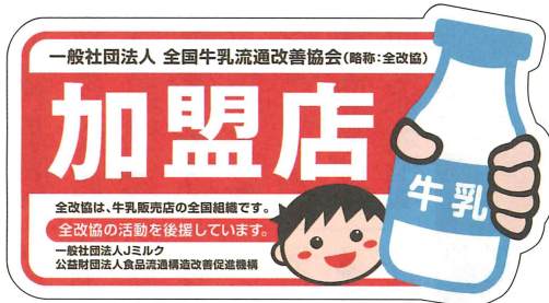
全改協加盟店証ステッカー

〔流改協さまへ 加盟店からご依頼があった場合や、新たに必要になった場合のステッカー、シール、マグネットシートの追加ご注文は、10枚単位で実費で承っております。全改協までお問い合わせください。〕