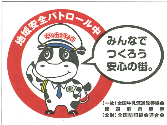
地域安全パトロールステッカー