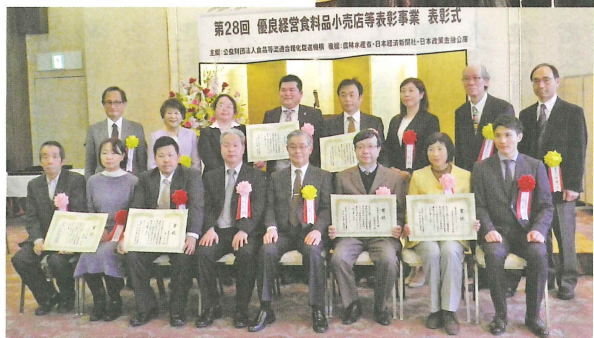
タカナン東開成直売店さん(前列左から3人目と4人目)